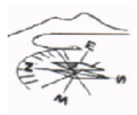
Ist. Tecnico nautico "Duca degli Abruzzi"