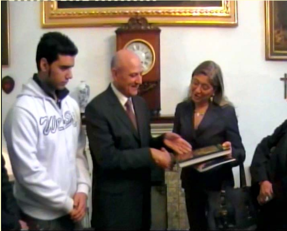
La consegna di un libro sulla storia di Malta